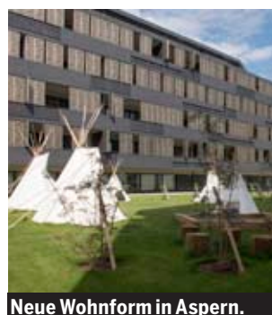
Neue Wohnform in Aspern.

Sie können zwischen zwei Wohnungstypen wählen: